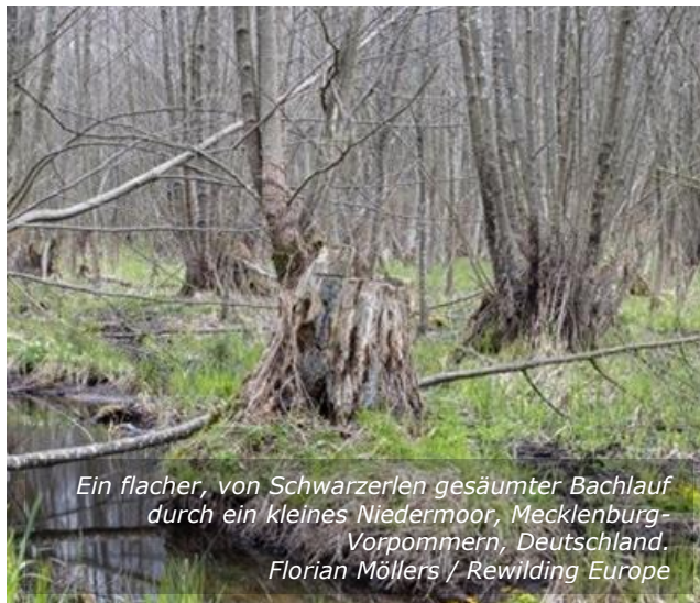
Ein flacher, von Schwarzerlen gesäumter Bachlauf durch ein kleines Niedermoor, Mecklenburg-Vorpommern, Deutschland.

Nachfolgend finden Rewilding-Projekte durchführende Personen einige reale Szenarien, die zeigen, wann verschiedene Mechanismen zur Sicherung und zum Schutz naturbelassene Landschaften am sinnvollsten sind.