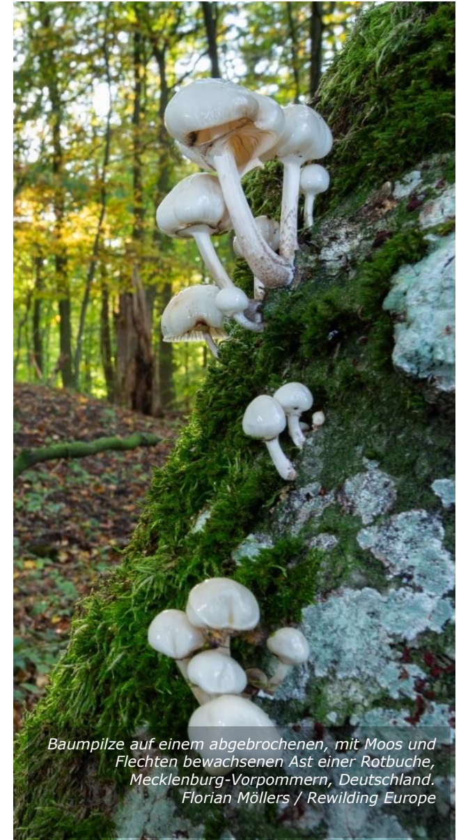
Baumpilze auf einem abgebrochenen, mit Moos und Flechten bewachsenen Ast einer Rotbuche, Mecklenburg-Vorpommern, Deutschland.

Ein entscheidender Vorteil ist, dass auch bei persönlichen Reallasten das Recht des Berechtigten übertragen werden kann, es sei denn, der Vertrag verbietet dies ausdrücklich. Daher kann eine Rewilding-Organisation das Recht an eine andere Einrichtung abtreten, wodurch die Kontinuität der Rewilding-Bemühungen gewährleistet werden kann. Die Übertragung der (persönlichen) Reallast muss im Grundbuch eingetragen werden.