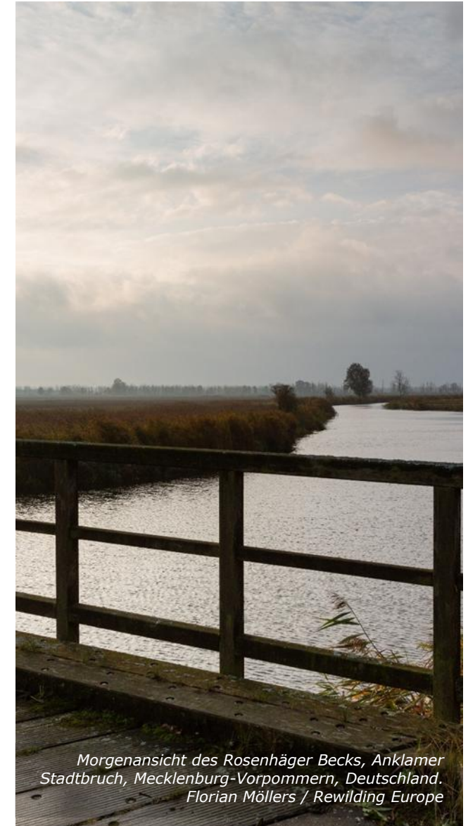
Morgenansicht des Rosenhäger Becks, Anklamer Stadtbruch, Mecklenburg-Vorpommern, Deutschland.

Naturschutzgebiete sind rechtsverbindlich festgesetzte Gebiete, in denen ein besonderer Schutz