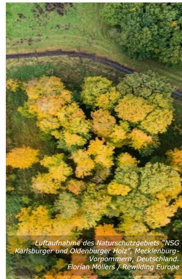
Luftaufnahme des Naturschutzgebiets "NSG Karlsburger und Oldenburger Holz", Mecklenburg-Vorpommern, Deutschland.

greifbaren Nutzen aus der Dienstbarkeit ziehen muss. Dies bedeutet, dass (i) die Rewilding-Organisation Eigentümer eines herrschenden Grundstücks sein muss; und (ii) die Dienstbarkeit einen anerkannten Nutzen für dieses Grundstück haben muss.