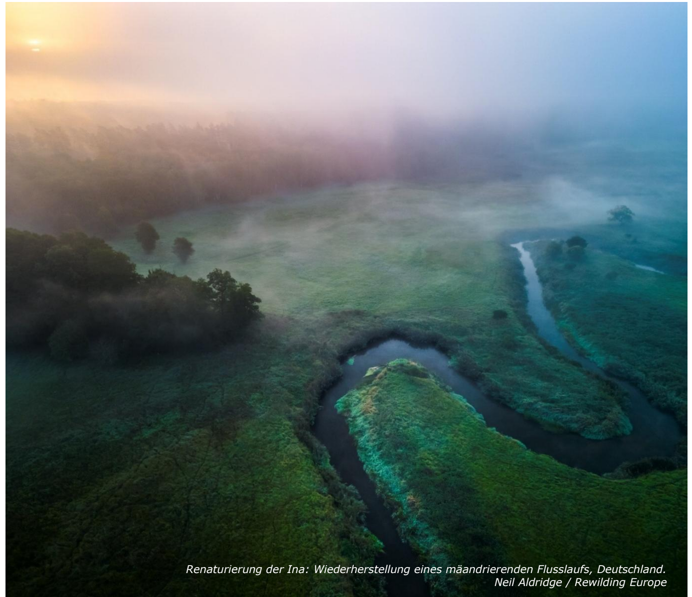
Renaturierung der Ina: Wiederherstellung eines mäandrierenden Flusslaufs, Deutschland.

Durch vertragliche Vereinbarungen zum Umweltschutz können Grundeigentümer ihre Flächen freiwillig zur Renaturierung zur Verfügung stellen. Die Verträge werden mit öffentlichen Stellen oder Vereinigungen geschlossen und können mit der Bereitstellung von Mitteln für bestimmte Umweltschutzmaßnahmen verbunden sein, insbesondere solche Maßnahmen, die häufig im Rahmen von Renaturierungsmaßnahmen durchgeführt werden.