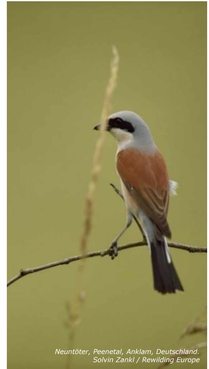
Neuntöter, Peenetal, Anklam, Deutschland.

Wenn eine Jagdgenossenschaft zuständig ist, teilen sich die Mitglieder die Kosten in der Regel im Verhältnis zur Größe ihrer Grundstücke innerhalb des Jagdbezirks.