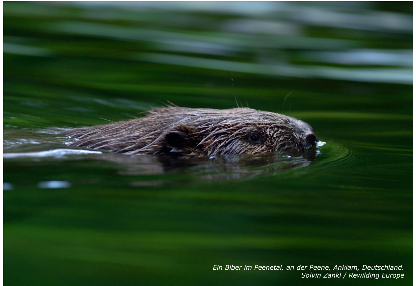
Ein Biber im Peenetal, an der Peene, Anklam, Deutschland.

Umsiedlungsprogramms freigesetzt wurden, endgültig endet. Das Oberlandesgericht Hamm stellte jedoch fest, dass es nicht gerechtfertigt wäre, eine Rewilding-Organisation für das Verhalten der Tiere auf unbestimmte Zeit haftbar zu machen. 30 Der Bundesgerichtshof wies ferner darauf hin, dass private Grundstückseigentümer grundsätzlich verpflichtet sein können, Schäden zu dulden, die Wisente an ihrem Eigentum verursachen, sobald die Tiere gemäß den einschlägigen rechtlichen Rahmenbedingungen endgültig freigesetzt wurden und damit herrenlos werden. 31