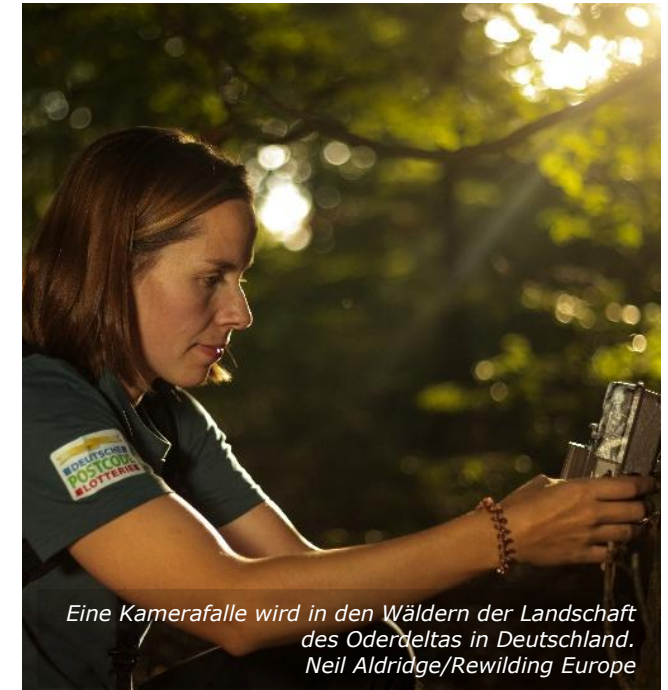
Eine Kamerafalle wird in den Wäldern der Landschaft des Oderdeltas in Deutschland.

sind Beispiele dafür, wie Risiken minimiert und gemindert werden können. Weiter wird empfohlen, angemessene Risikobewertungen durchzuführen und, soweit möglich, eine Haftpflichtversicherung abzuschließen, die von Tieren verursachte Schäden abdeckt.