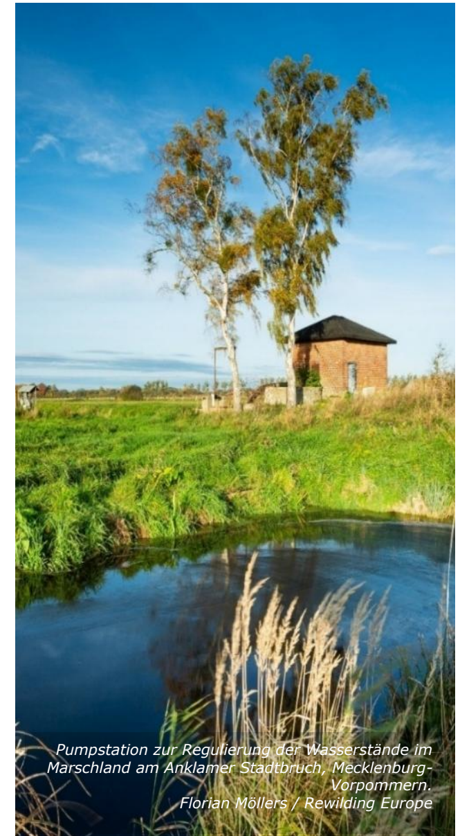
Pumpstation zur Regulierung der Wasserstände im Marschland am Anklamer Stadtbruch, Mecklenburg-Vorpommern.

Da Grundstückseigentümer D alle einschlägigen Vorschriften insbesondere das Abstandsgebot befolgt hat, fehlt es an einer Pflichtverletzung, sodass er grds. nicht für den Schädlingsbefall haftbar gemacht werden kann.