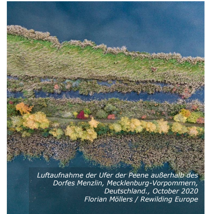
Luftaufnahme der Ufer der Peene außerhalb des Dorfes Menzlin, Mecklenburg-Vorpommern, Deutschland., October 2020 Florian Möllers / Rewilding Europe

Es gibt eine wichtige Ausnahme. Wenn ein Grundstück geerbt oder geschenkt wird, wird keine Grunderwerbsteuer fällig. 29 Stattdessen wird die Übertragung nach den Regeln der Erbschafts- und Schenkungsteuer behandelt (siehe Abschnitt 6).