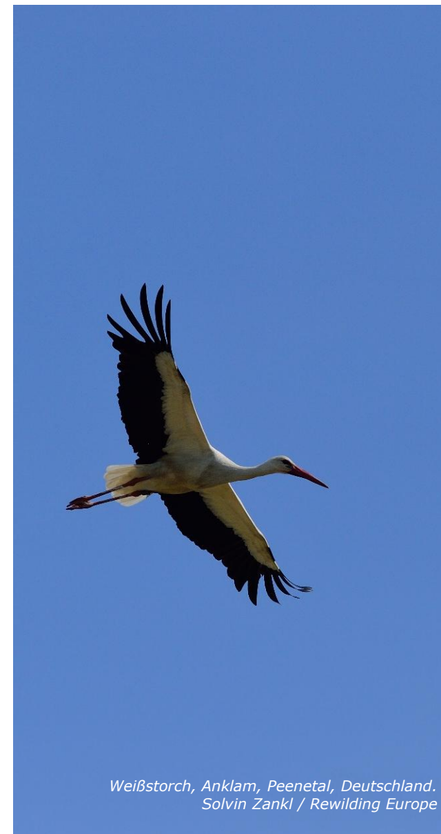
Weißstorch, Anklam, Peenetal, Deutschland. Solvin Zankl / Rewilding Europe