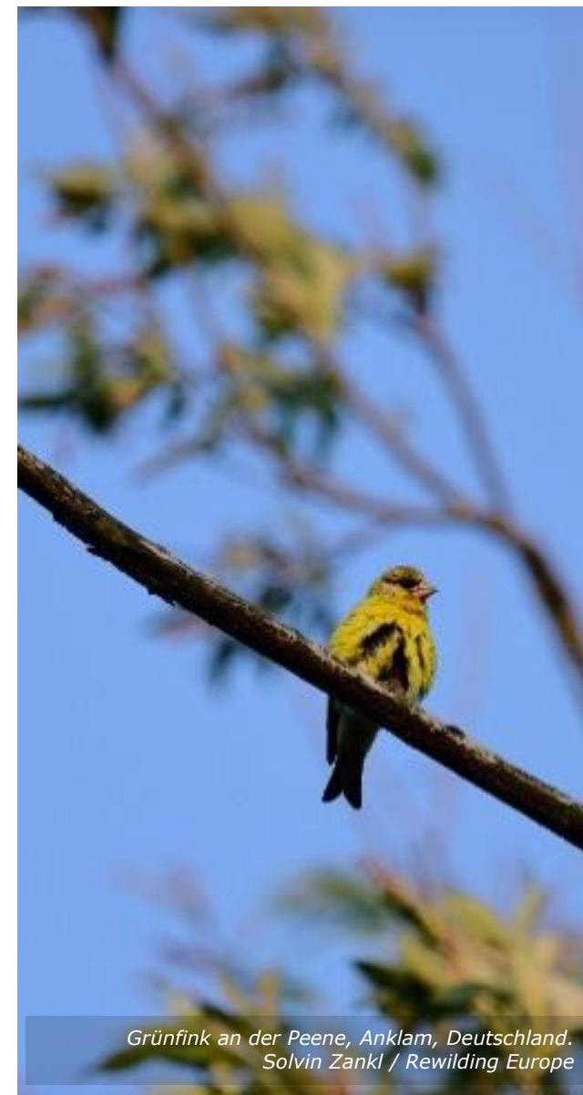
Grünfink an der Peene, Anklam, Deutschland.

Aufgrund dieser Ungewissheit sollte jede Subvention, die an Bedingungen oder Zielvorgaben geknüpft ist, zusammen mit einem Steuerberater sorgfältig geprüft werden, um festzustellen, ob sie umsatzsteuerpflichtig ist.