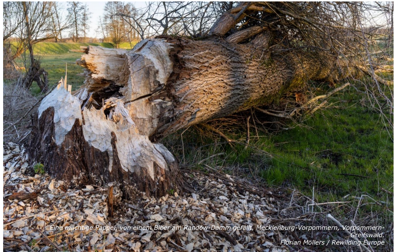
Eine mächtige Pappel, von einem Biber am Randow-Damm gefällt, Mecklenburg-Vorpommern, Vorpommern-Greifswald.

Wichtig ist in diesem Zusammenhang, dass der Bundesfinanzhof bestätigt hat, dass der Status der Gemeinnützigkeit grundsätzlich nicht beeinträchtigt wird, wenn eine gemeinnützige Organisation Ökopunkte verkauft, die sie im Rahmen ihrer üblichen gemeinnützigen Tätigkeit erworben hat. 35