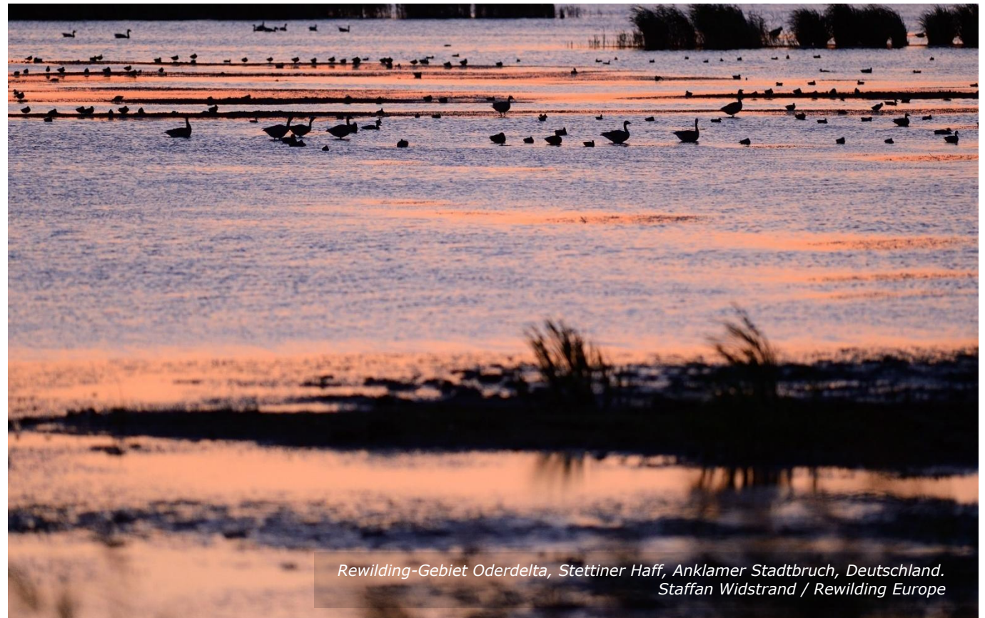
Rewilding-Gebiet Oderdelta, Stettiner Haff, Anklamer Stadtbruch, Deutschland.

Wenn keine Warnschilder angebracht wären, würde ein Gericht prüfen, wie wahrscheinlich es ist, dass das versteckte Abflussgitter gesehen wird. Wenn das Gitter versteckt und schwer erkennbar war, kann Grundstückseigentümer D gegebenenfalls für die Verletzung haftbar gemacht werden.