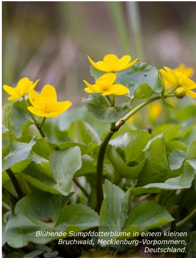
Blühende Sumpfdotterblume in einem kleinen Bruchwald, Mecklenburg-Vorpommern, Deutschland.

Verpflichtung besteht, ihren Wald regelmäßig auf potenzielle Risiken hin zu kontrollieren, können sie dennoch verpflichtet sein, nach einer "Megagefahr" wie einem schweren Sturm gezielte Kontrollen durchzuführen. Wenn sie also aus den Nachrichten oder auf andere Weise im Nachhinein von einer solchen "Megagefahr" erfahren, sollten sie ihren Wald sorgfältig kontrollieren, um das Entstehen eines möglichen Haftungsgrunds zu vermeiden. 14