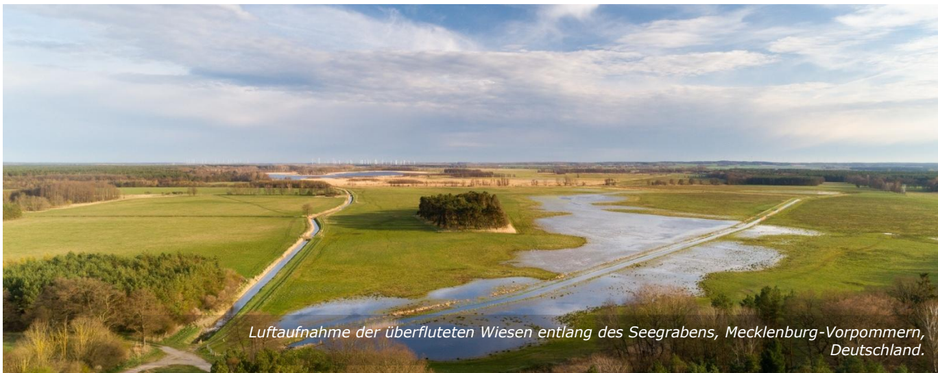
Luftaufnahme der überfluteten Wiesen entlang des Seegrabens, Mecklenburg-Vorpommern, Deutschland.

Grundstückseigentümer F ist wahrscheinlich haftbar, da der Stall, der aufgrund eines Baumangels eingestürzt ist und Verletzungen verursacht hat, sein Eigentum ist. Er könnte eine Haftung nur dann vermeiden, wenn er nachweisen könnte, dass er alles getan hat, um einen Schaden zu verhindern, oder wenn er nachweist, dass der Schaden unvermeidbar war. Die Gerichte werden auch prüfen, ob Grundstückseigentümer F sorgfaltswidrig gehandelt hat, das heißt, ob er den Baumangel kannte, aber weder versucht hat, ihn zu beheben, noch später erforderliche Wartungsarbeiten durchgeführt hat.