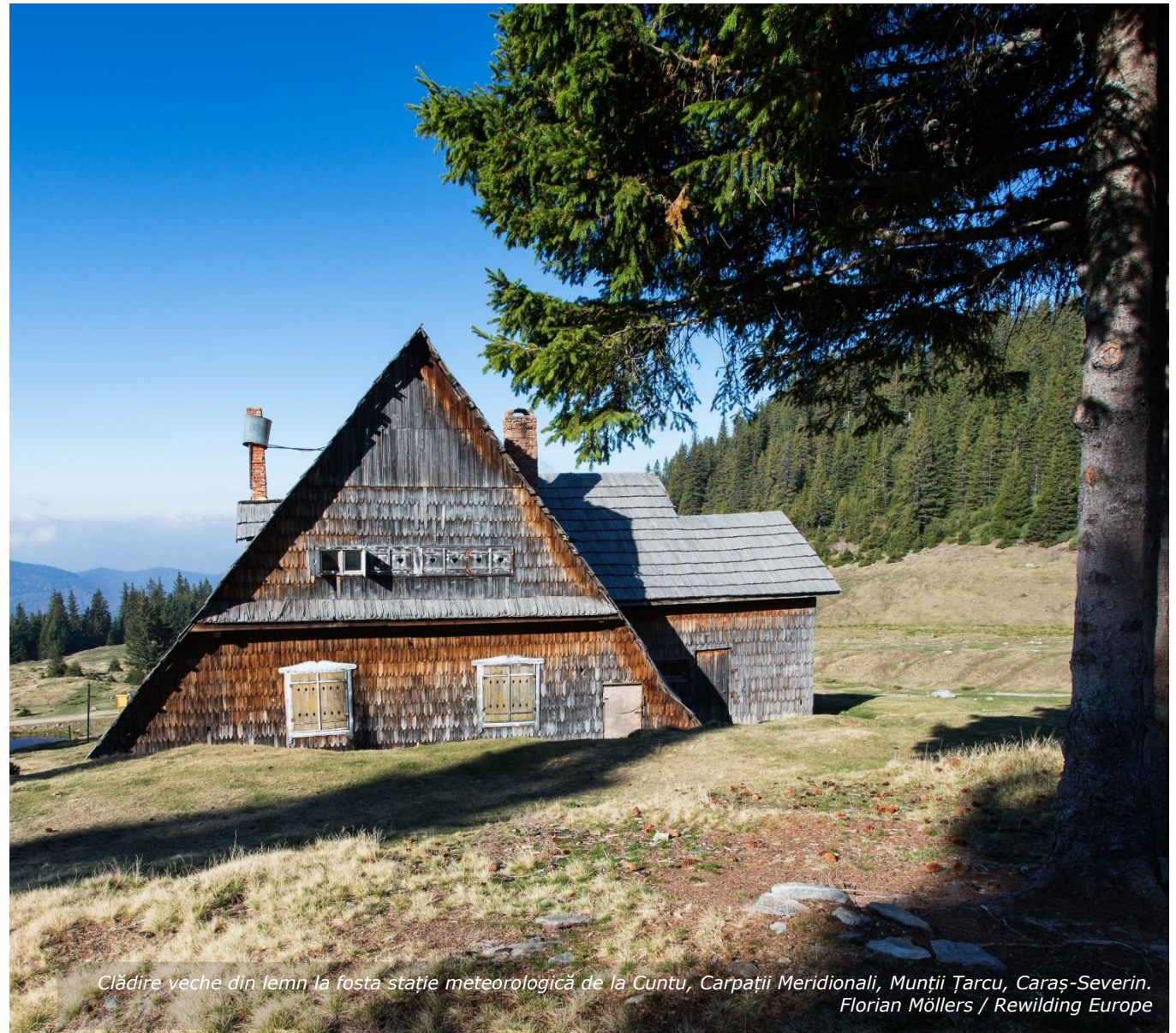
Clădire veche din lemn la fosta stație meteorologică de la Cuntu, Carpații Meridionali, Munții Ţarcu, Caraş-Severin.

Proprietarul terenului ar trebui să ia în considerare și dacă eroziunea în timp ar fi putut fi prevăzută sau atenuată. Dacă eroziunea a fost o consecință graduală și previzibilă a modificării sistemelor de protecție a râului, răspunderea ar putea decurge din neglijență sau din neadoptarea măsurilor de precauție, mai curând decât dintr-un singur eveniment de forță majoră.