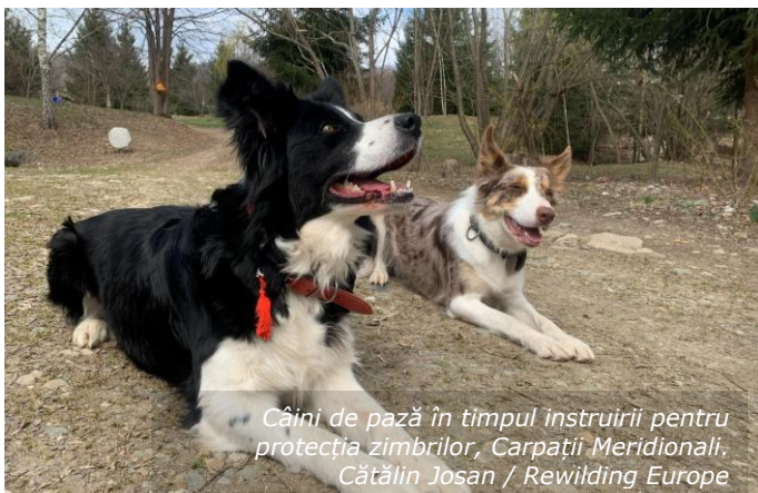
Câini de pază în timpul instruirii pentru protecția zimbriilor, Carpații Meridionali.

Există zone juridice neclare și se recomandă cu tărie consultanță juridică specifică pentru orice activitate de reintroducere a speciilor sălbatice (a se vedea informații suplimentare în Resălbăticirea în România: Reintroducerea speciilor sălbatice ).